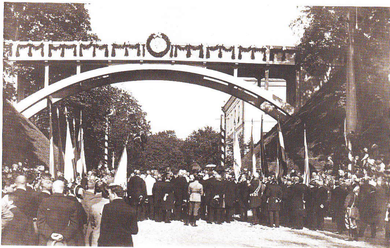
Kuradisilla avamistseremonia 1. septembril 1913. aastal.

Igal pool punane-sinine-walge wärw ... Neljapäewal on juba k. 9 homm. pääle rahwast rohkem kui harilikult linna pääuulitsatel liikumas. Rahwa hulk tiheneb järjest ja umbes k. 11 aegu on weel suure wawaga wõimalik Suure-turu äärde pääseda. K. ½ 12 jõuab kohalik sõjawägi Suurele-turule – piduliku paraadi platsile. Sellele järgnewad poisslaste- ja tütarlaste gümnaasium, linnakool oma muusikakooriga, kõikide algkoolide õpilased ja tuletõrjujad, niisama ka wärwikandjad üliõpilased oma lippudega. Raatuse ees peeti lühikest palwet Kreeka-katoliku kombe järele. Selle järele mängis koolide, sõjawäe ja tuletõrjujate ühendatud muusikakoor riigilaulu ja kõik paraadist osawõtjad lahkuwad tseremoniaalmaršil Suurelt-turult."