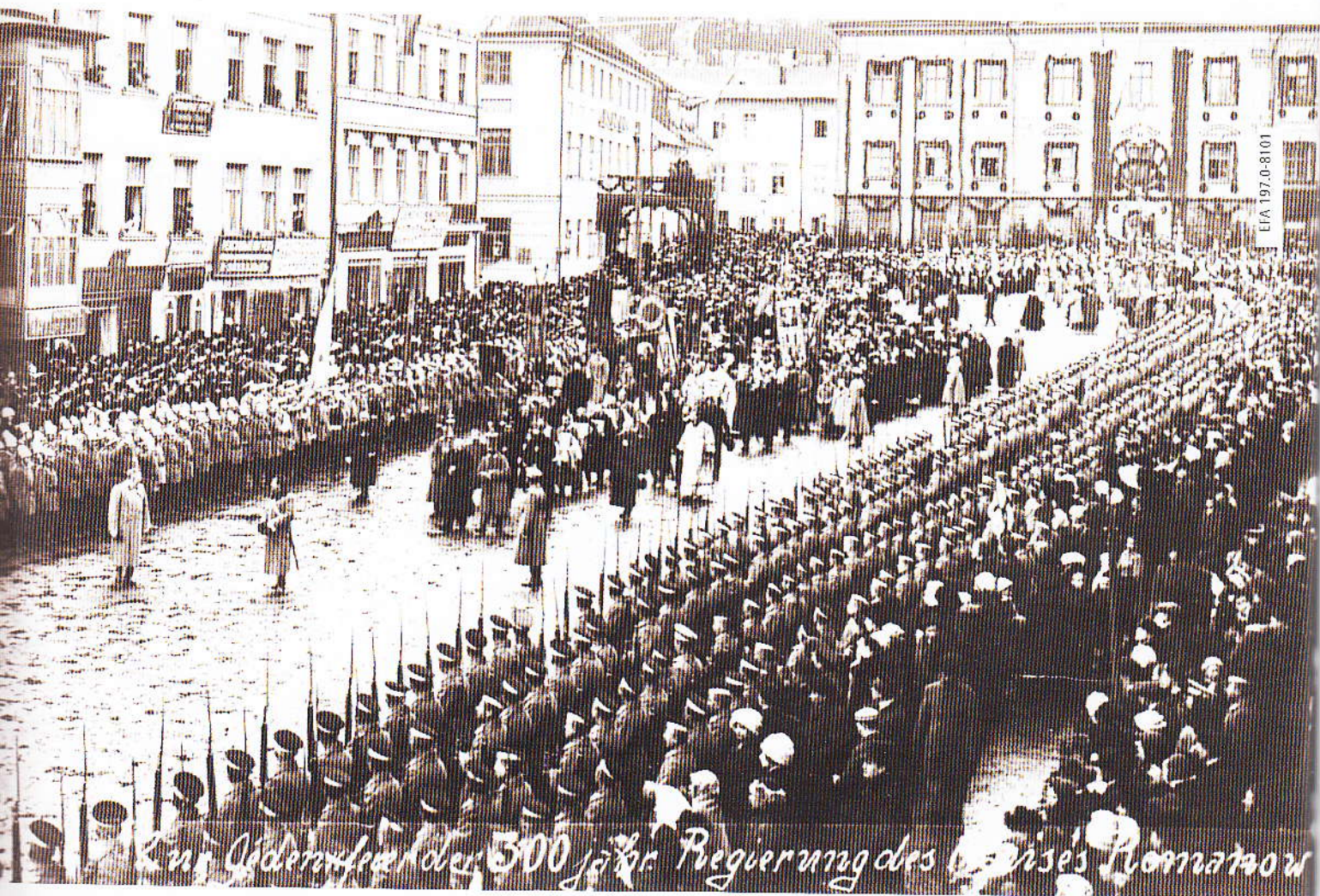
Romanovite dünastia 300. aasta juubeli pidustused Tartus 21. veebruaril 1913. aastal.