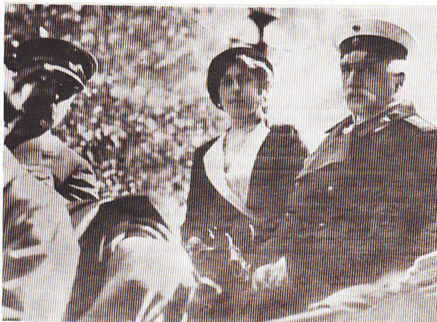
1913. aasta suursõit. Keskul suurvürstinna Viktoria Fjodorovna, paremal Liivimaa kuberner Nikolai Aleksandrovits Zvegintsov, vasakult kiikab vürst Nikolai Dmitrijevits Kropotkin.

Romanovite juubelipidustuste päevaks Tartus oli 21. veebruar 1913. Selle päeva sündmustest annab ülevaate 22. veebruari Postimees: „Linn on juba kolmapäewa õhtust pääle piduülikonnas. Majad ehiwad lipud. Raatuse hoone, loomaarsti-ülikooli maja ja palju teiste kõrwalisi majasid on kuuse-pärgadega ilustatud. Kesklinna uulitsatel on pea igale kaupluse aknale walitsejapaari pildid wõi rinnakujud wälja pandud.